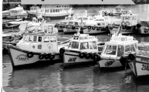
Imagen 4: Puerto de Valparaíso