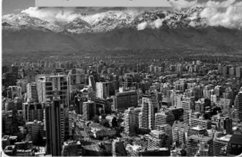
Imagen 1: Santiago

observa las siguientes imágenes y determinan a qué zona geográfica pertenece (norte, centro o sur) y las ventajas y desventajas de ese paisaje en particular.