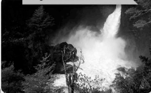
Imagen 3: Salto del Huilo-huillo